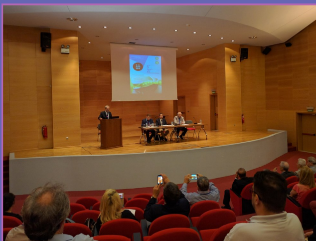
5ο Διεθνές Συμπόσιο και 27ο Εθνικό Συνέδριο Ε.Ε.Ε.Ε., Αθήνα, 2016