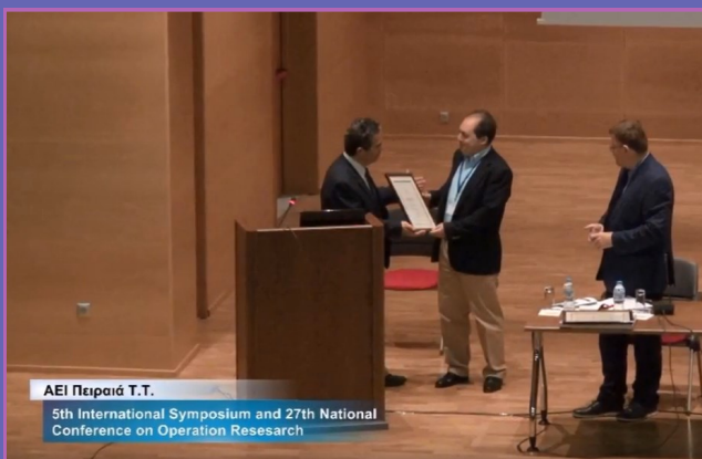
ΑΕΙ Πειραιά Τ.Τ. 5th International Symposium and 27th National Conference on Operation Resesarch